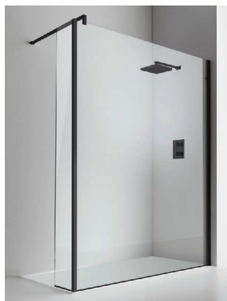
Con paraspruzzi fisso