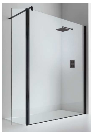
Con paraspruzzi mobile