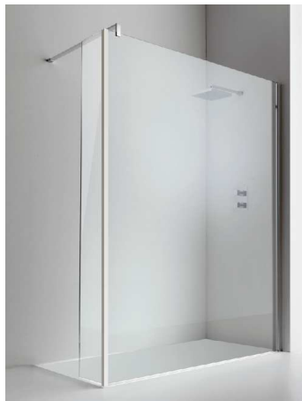
Con paraspruzzi fisso