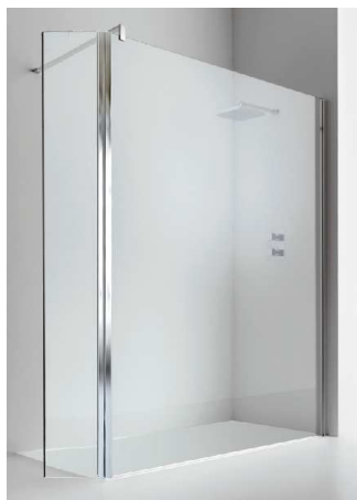
Con paraspruzzi mobile