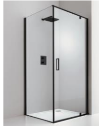
(in foto verso DX)