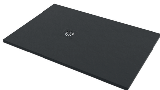
IMMAGINE PRODOTTO / PRODUCT IMAGE