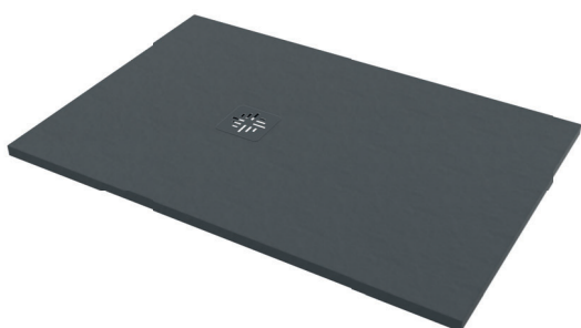
IMMAGINE PRODOTTO / PRODUCT IMAGE