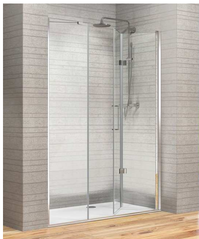
Esempio Porta pieghevole 80 + In-Line 40